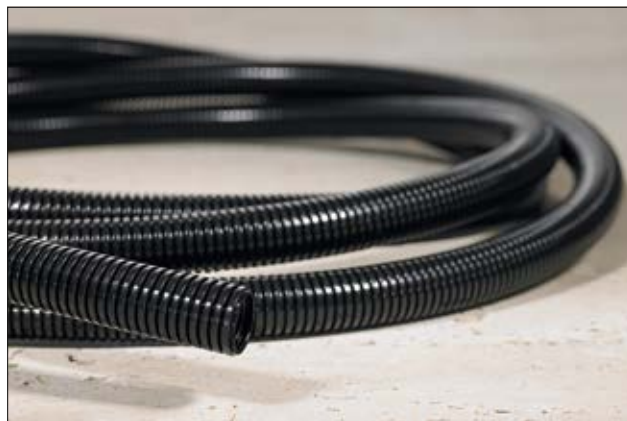
HG-LW - kevyt rakenne, yleiskäyttöön.